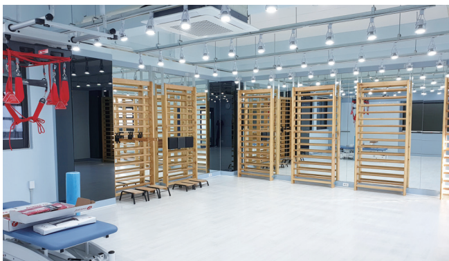
스포츠예방 분석 실습실