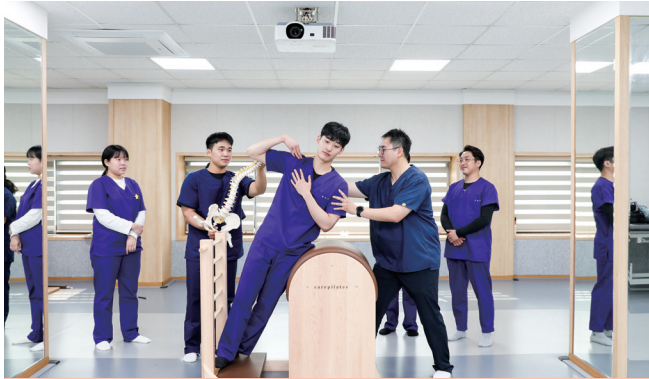
스포츠예방 필라테스 실습실