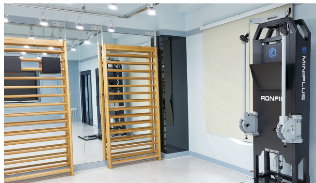
등속성 측정 / 훈련 장비