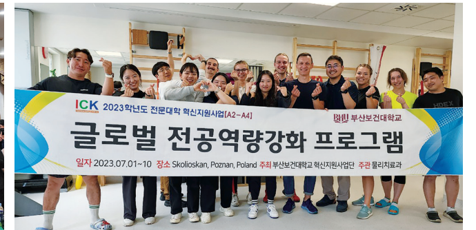
폴란드 측만전문 운동센터 연수