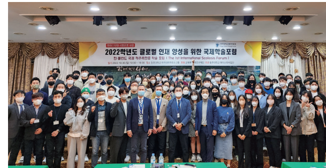
척추측만증 국제학술 포럼 개최