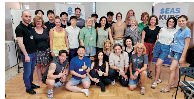
한국 최초 이탈리아 척추측만증 특화운동법 SEAS Level2 과정 이수